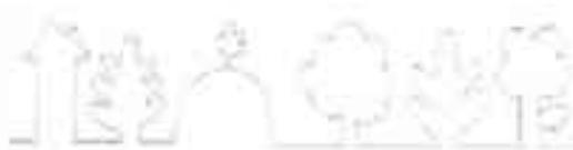
Рис. 3. Методика «Лес».

По окончании обследования высчитывается средний балл на каждого ребенка, т.е.